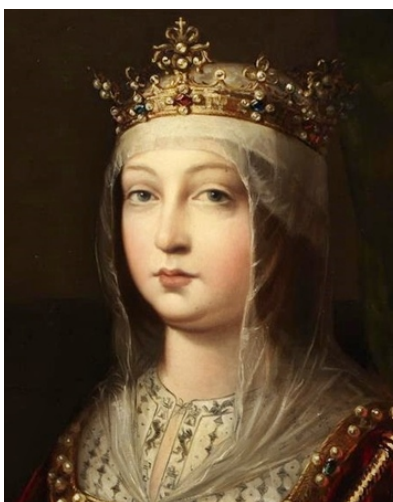
Regina Isabella di Spagna 1451-1501