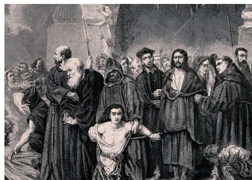
Gli orrori dell'Inquisizione spagnola

Questo regno potrebbe infatti essere chiamato di “Isabella e Ferdinando” per il duplice governo di questi “Re Cattolici” di Spagna, come viene chiamata la coppia che rimodellò il mondo e lanciò imprese che ai loro tempi ebbero un effetto titanico e che oggi continuano a influenzare la vita di milioni di persone. Proprio come Michael H Hart, nel suo libro The 100: A Ranking of the Most Influential Persons in History , scelse Isabella al posto di Ferdinando a motivo di inclusione, così anche noi e per la sua stessa ragione: sebbene “la maggior parte delle sue politiche siano state decise previa consultazione con il marito scaltro e altrettanto capace, furono i suoi suggerimenti ad essere adottati nelle loro decisioni più importanti”. Queste decisioni portarono, tra l’altro, alla riconquista della Spagna da parte dei Mori, all’istituzione dell’Inquisizione spagnola, all’invio di Cristoforo Colombo in America (e a tutte le sue conseguenze imprevedibili) e alla spartizione del mondo allora conosciuto con i portoghesi.